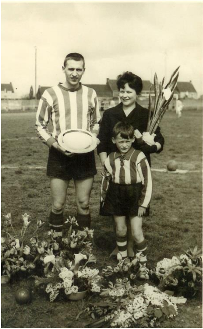
Viering Sidon 400