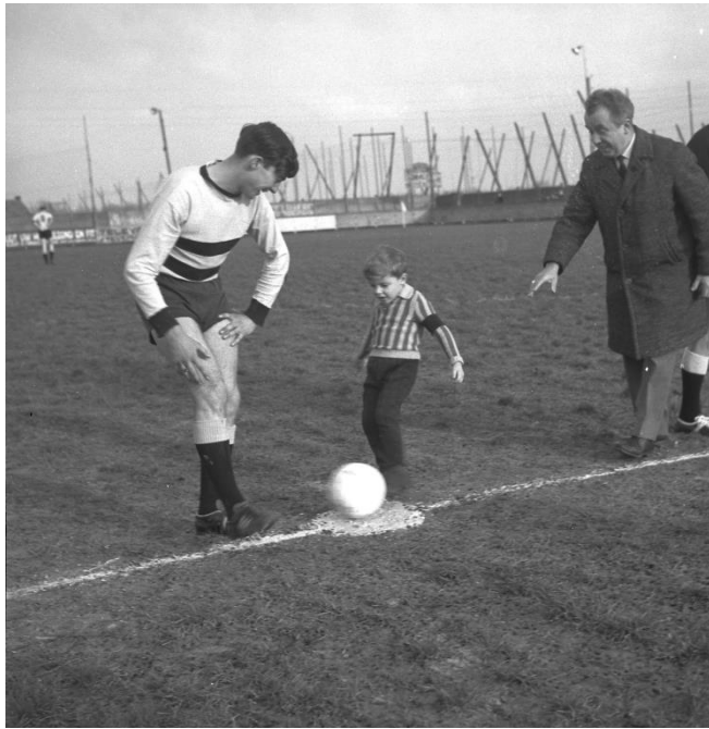
De aftrap ...