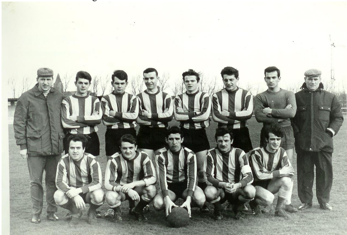
24 april 68 Heist – KFC 0-1