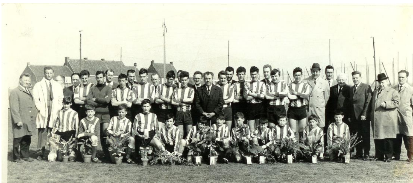
31 maart 68 KFC – Ingelmuster