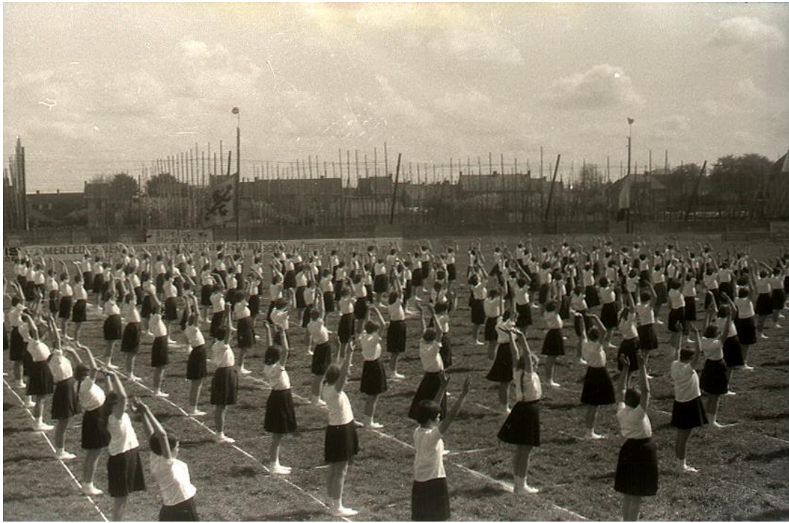
Dansfeest Sint Franciscusinstituut