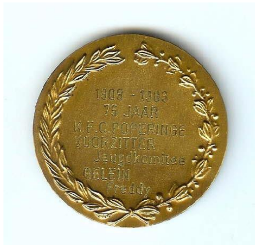
Herinneringsmedaille 75-jarig Jubileum KFC Poperinge