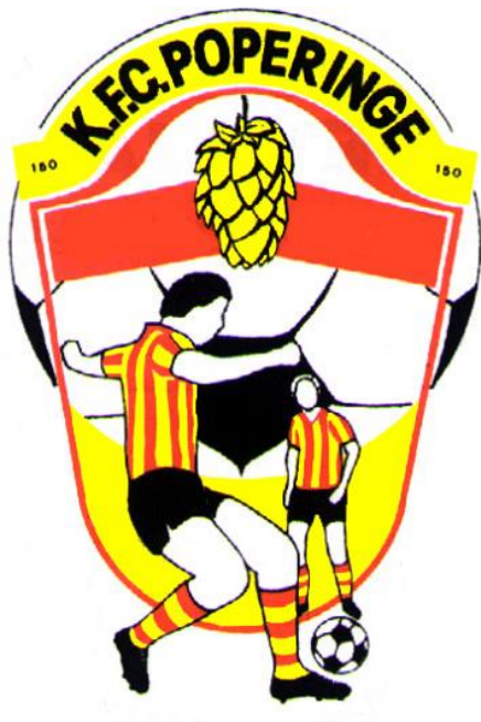
Sticker Cyr Frimout 75-jarig Jubileum KFC Poperinge